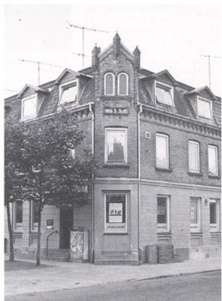
Bladhuset i Skibbrogade.